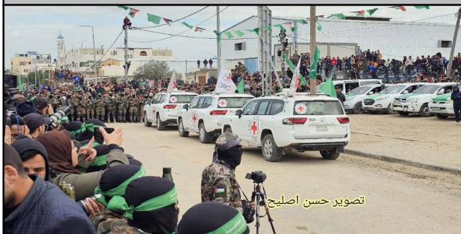
تصویر حسن اصلیح

منابع رسانه‌ای گزارش داده‌اند که مقام‌های امریکا و حماس مستقیماً درباره آزادی اسرا گفتگو کرده‌اند. همچنین ترامپ بار دیگر حماس و حتی مردم غزه را به بازگشایی دروازه جهنم و مرگ در صورت عدم آزادی فوری اسرا تهدید کرد. براساس گزارش رویترز، کاخ سفید تأیید کرده است که نمایندگان امریکا با حماس مذاکرات مستقیم و محرمانه درباره آزادی گروگان‌ها داشته‌اند. کاخ سفید گفته است که آدام بولر، فرستاده امریکا در امور اسرا، صلاحیت مستقیم گفتگو با حماس را دارد. رویترز به نقل از منابع مطلع گفته است که فرستاده امریکا و مقام‌های حماس در هفته‌های اخیر در دوحه، گفتگو کرده‌اند. براساس گزارش این رسانه، مشخص نیست که از جانب حماس چه کسی در این مذاکرات حضور داشته است. مذاکرات مستقیم امریکا و حماس در حالی انجام شده است که پیش از این مقام‌های این کشور با گروه‌هایی که در فهرست گروه‌های تروریستی آن کشور قرار داشتند، به صورت مستقیم مذاکره نمی‌کردند. همزمان با تأیید این مذاکرات، دونالد ترامپ، رییس‌جمهور امریکا در کاخ سفید با شماری از اسرای آزاد شده دیدار کرد. ترامپ پس از این دیدار به حماس هشدار داد که همه اسرا را فوراً آزاد کند، در غیر آن صورت هیچ‌یک از اعضای حماس در امان نخواهد بود. او به مردم غزه نیز گفت که «زندگی زیبا در انتظار شما است؛ امانه با گروگان‌گیری، اگر گروگان‌ها را نگهدارید، جهنمی در انتظار شما خواهد بود و همگی خواهید مرد!» حماس تاکنون به هشدار ترامپ واکنش نشان نداده است؛ اما مجاهدین فلسطین این هشدار را محکوم کرده و گفته است که نشان‌دهنده قصد دولت ترامپ در مشارکت در جنایت نسل‌کشی اسرائیل علیه مردم فلسطین است.