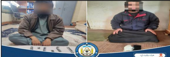
په هرات کې دوه تنه د نشه یی توکو د پلور په تور ونیول سول

د فتر مطبوعاتی پولیس هرات از بازداشت پنج تن در پیوند به فروش مواد مخدر و مشروبات الکولی بدست آمده، و اکنون تحت نظارت قرار دارند. همچنان به اساس یک خبرنامه ی دیگر؛ پرسونل مدیریت مبارزه با مواد مخدر ولسوالی اوبه طی یک عملیات کشفی در قریه هفت گلکه مقدار (۱۰۴۰۰) کیلوگرام مواد مخدر تحت نام (اومان) کشف و حریق نمودند. در پیوند به این قضیه دو تن بازداشت شدند.