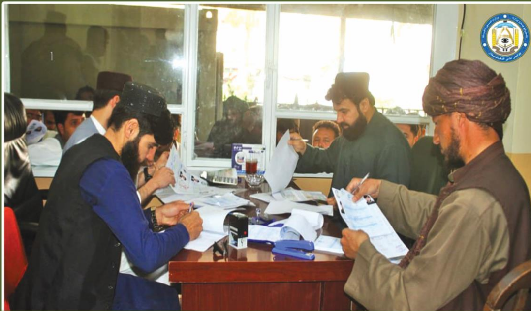
استقبال شهروندان هرات از افزایش روند توزیع پاسپورت

کارگاه آموزشی: موانع فرهنگی توسعه سیاسی در افغانستان