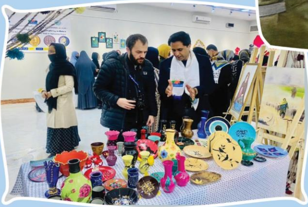
زنان هرات تولیدات دسته شان را به نمایش گذاشتند