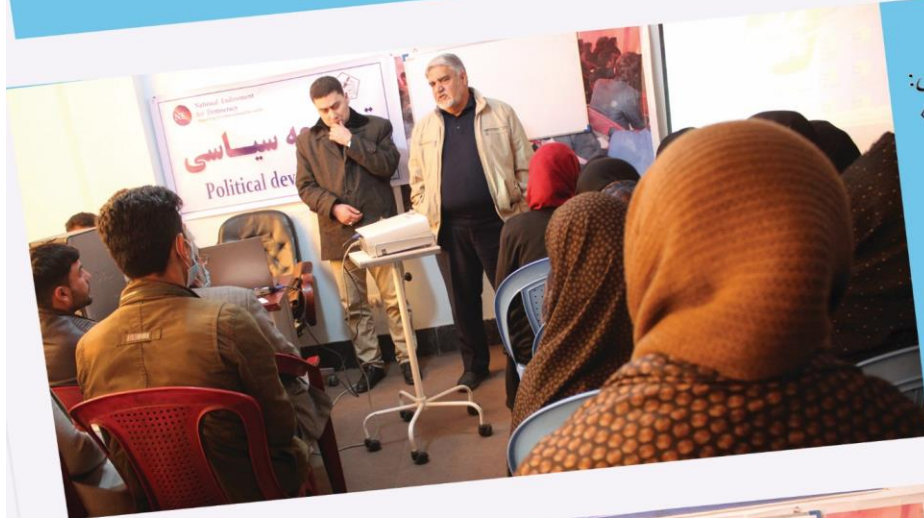
کارگاه آموزشی: « توسعه سیاسی »