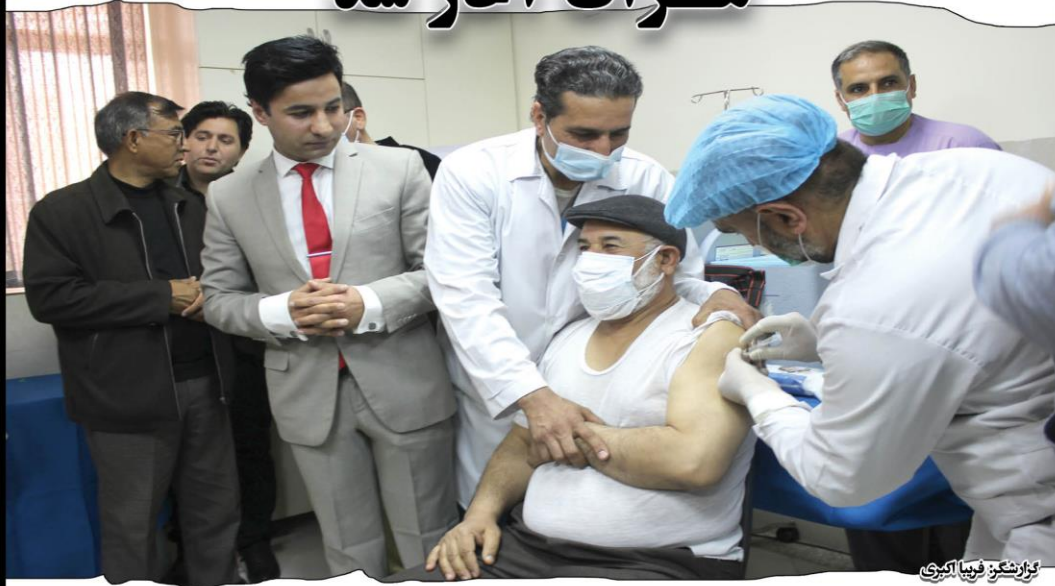
گزارشگر: فریبا اکبری

از کارمندان در حالت مایوسانه‌ی بسر می‌بردند و این جای خوشحالی است که واکسن کرونا ساخته شده و کارمندان صحتی جز اولین دریافت کنندگان این واکسن هستند. گفتنی است که نخستین دور تطبیق واکسن کرونا در افغانستان با حضور رییس جمهور و سفیر کشور هند سه‌شنبه، ۵ حوت آغاز شد و وزارت صحت افغانستان ۵۰۰ دوز واکسن کرونایی ساخت کشور هند به گونه‌ی کمک دریافت کرد و قرار است این تعداد واکسن به ۲۵۰ هزار نفر تطبیق شود.