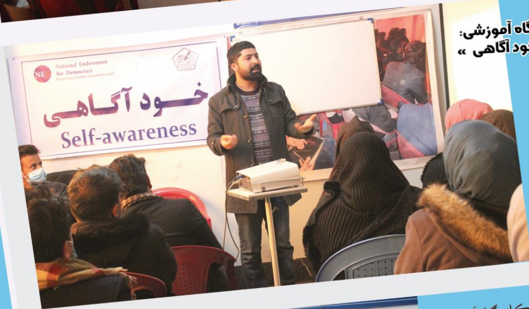
کارگاه آموزشی: « خود آگاهی »