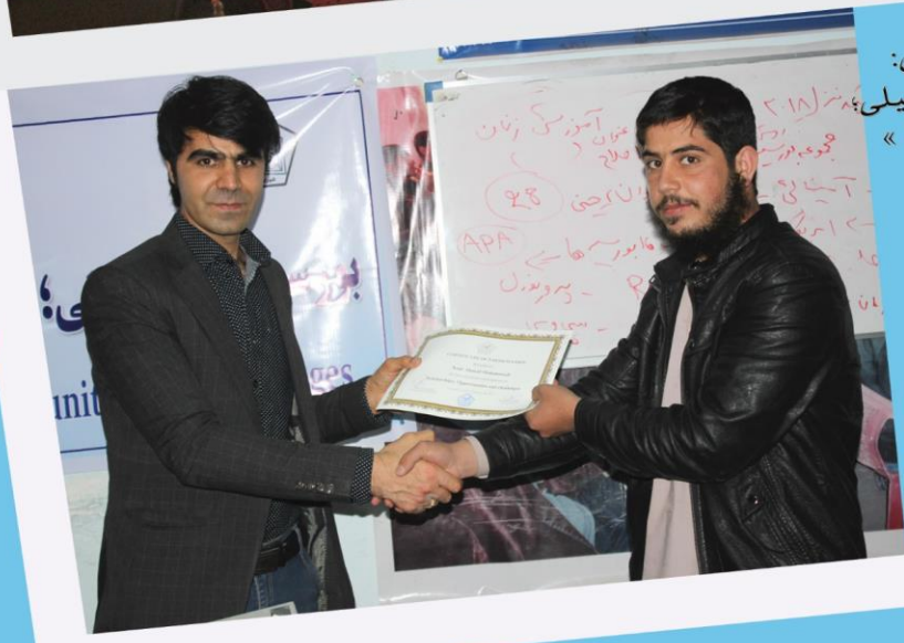
کارگاه آموزشی: « بورسیه‌های تحصیلی؛ فرصت‌ها و چالش‌ها »